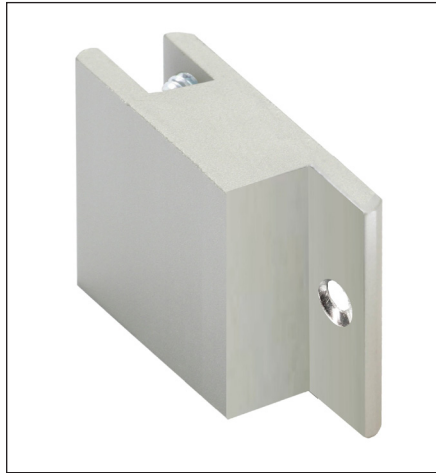
Spezialmittelverbinder silber eloxiert mit Stahlklemmschrauben